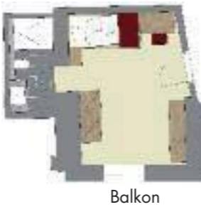
Balkon (25 m 2 inkl. 5 m 2 Balkon)

Der gemütliche Charme der Zimmer zeigt sich auch an der kleinen Wohnecke die zum Rasten und Ruhen nach einem spannenden Tag perfekt geeignet ist. Oder genießen Sie einfach nur die Kraft der Sonne auf der großzügigen Terrasse.