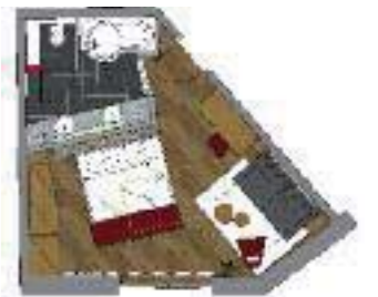
Balkon (33 m 2 inkl. 7 m 2 Balkon)

Unser Studio vermittelt modernen, alpinen Charme. Auf dem Südbalkon erleben Sie, wie die Sonne über den Bergen glänzt. Auf den Zusatzbetten finden auch Ihre kleinen Lieblinge Platz (bis zu 3 Personen), in der kombinierten Badewanne – Dusche relaxen Sie nach dem Skifahren Ihre Muskeln, können Sie aber auch ideal eine kurze Dusche genießen. Die übliche Ausstattung finden Sie selbstverständlich auf dem letzten Stand der Technik.