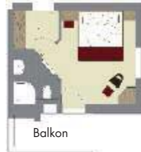
Balkon (25 m 2 inkl. 5 m 2 Balkon)

Der Balkon oder die Terrasse bieten einen traumhaften Blick auf die Lecher Bergwelt und laden zum Entspannen und Verweilen ein.