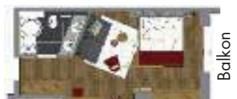
Balkon (33 m 2 inkl. 5 m 2 Balkon)

Unser Studio vermittelt modernen, alpinen Charme. Sie sehen aus dem Bett beim Erwachen die herrliche Lecher Bergwelt. Auf den Zusatzbetten finden auch Ihre kleinen Lieblinge Platz (bis zu 4 Personen), in der kombinierten Badewanne – Dusche relaxen Sie nach dem Skifahren Ihre Muskeln, können Sie aber auch ideal eine kurze Dusche genießen. Auf dem Balkon erleben Sie, wie die Abendsonne spät hinter den Berggipfeln versinkt. Die übliche Ausstattung finden Sie selbstverständlich auf dem letzten Stand der Technik.