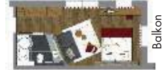
Balkon (32 m 2 inkl. 5 m 2 Balkon)

Unsere Studios vermitteln modernen, alpinen Charme. Sie sehen aus dem Bett beim Erwachen die herrliche Lecher Bergwelt. Auf den Zusatzbetten finden auch Ihre kleinen Lieblinge Platz (bis zu 4 Personen), in der kombinierten Badewanne – Dusche, relaxen Sie nach dem Skifahren Ihre Muskeln, können Sie aber auch ideal eine kurze Dusche genießen. Auf dem Balkon erleben Sie, wie die Abendsonne spät hinter den Berggipfeln versinkt. Die übliche Ausstattung finden Sie selbstverständlich auf dem letzten Stand der Technik.