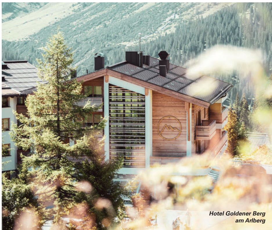
Hotel Goldener Berg am Arlberg

Daniela Pfefferkorn begeistert das Holistic Selfcare Konzept nicht erst seit gestern. Über die Jahre hat sie ihr Hotel zu einem weltoffenen Mekka für gesundheitsbewusste Menschen erblühen lassen. Und diesen Frühling wird es umfassend erweitert: So lässt der unterirdische Tunnel schon bei der Anreise stimmungsvoll in die neue Welt des goldenen Energiebergs eintauchen. Der Spa-Bereich wird teilweise vergrößert und um einen neuen Raum, der ganz im Zeichen des intuitiven Tuns und der Energiemedizin steht, erweitert. Die Kaminstube im Alten Goldenen Berg bekommt ein neues Gesicht; lädt zu Retreats, Yogasessions, Meditationsrunden, aber auch Hochzeiten und