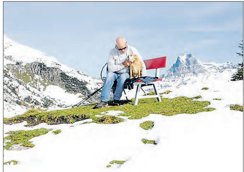
Gipfel erreicht, eine Ruhepause ist angebracht: Freies Herumtollen auf dem Berg war in diesen Tage die Hauptbeschäftigung.