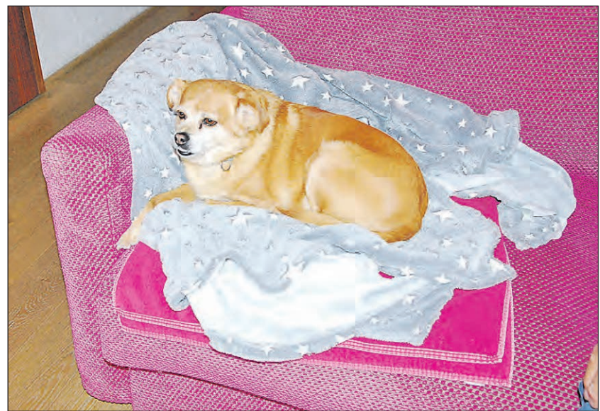
Von der ersten Sekunde an «zu Hause»: Die Sofaecke, gepolstert mit dem flauschigen Hunde-Frotteetuch und der eigenen Decke wurde spontan zur Lieblingssecke erkoren.