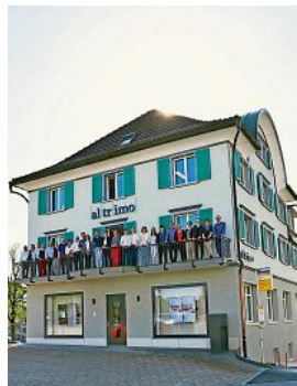
Altrimo steht für umfassenden und kompetenten Service. z.Vg.

zen, Treuhand, Recht, Immobilien und Informatik anbieten.