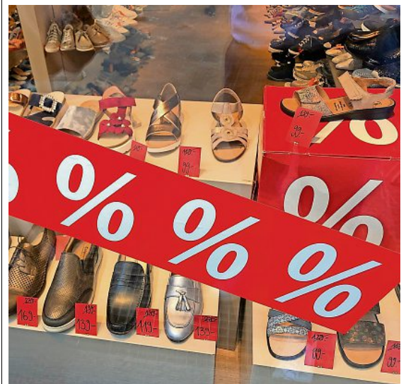
Bei Schneider Schuhe finden Sie modische Sommerschuhe zu Toppreisen. z.Vg.

071 222 66 05 info@schneiderschuhe.ch www.schneiderschuhe.ch